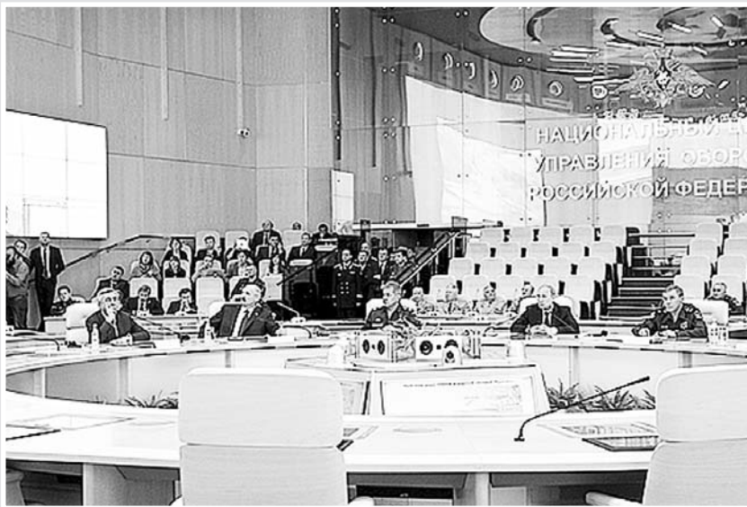
8 травня Російська Федерація провела чергове тренування військ, в рамках якого відпрацьовувалися питання застосування окремих частин і з’єднань ракетних військ, артилерії, авіації, ППО, військ повітряно-космічної оборони. Управління тренуванням здійснювалося із Національного центру управління обороною країни, а слідували за ним, окрім першої особи РФ, керівники країн ОДКБ – лідери Білорусії, Вірменії, Таджикистану та Киргизії.

чної ракети “Тополь”, яка із завзятістю точністю вразила умовну ціль на полігоні Кура. У свою чергу підводні крейсери стратегічного призначення “Тула” і “Подольск” з підводного положення здійснили пуски балістичних ракет з акваторій Баренцового і Охотського морів. Головні частини ракет прибули у визначені точки на полігоні Чича і Кура.